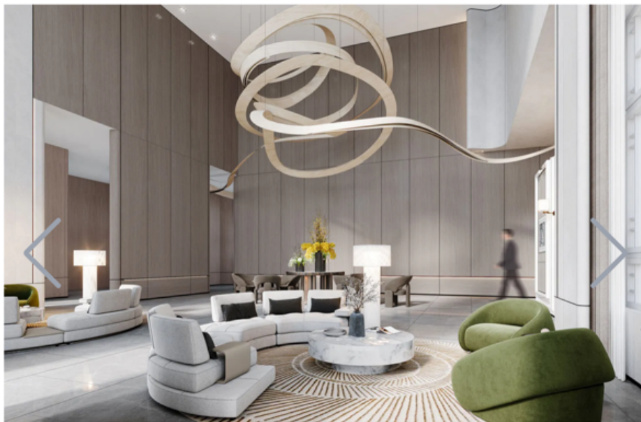
Clinique La Prairie a Anji