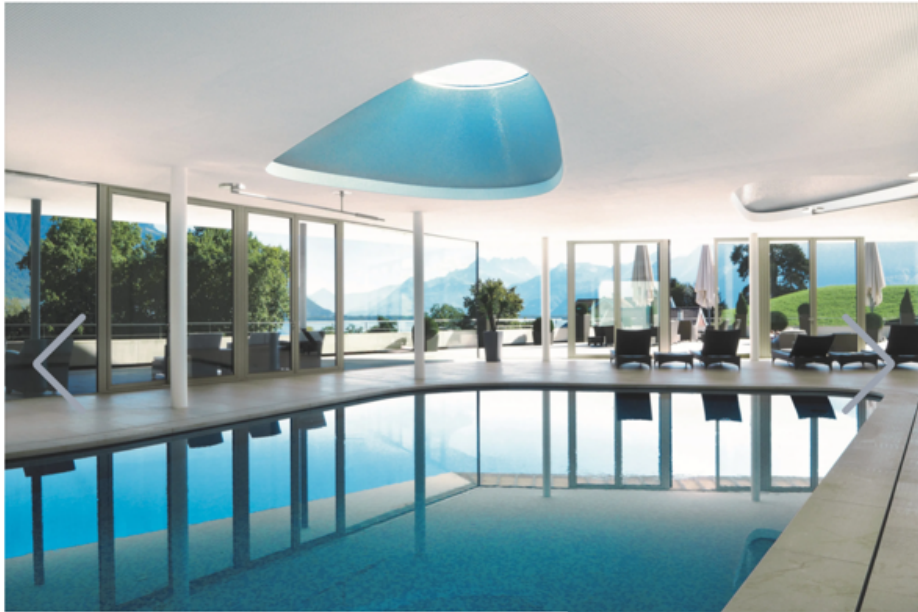
La piscina a Montreux