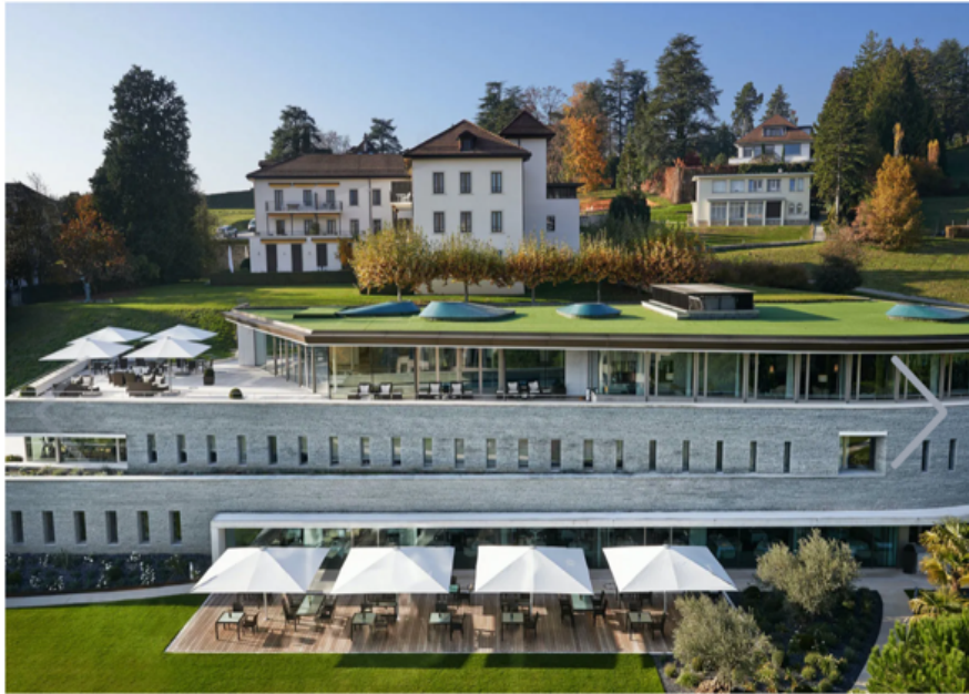
La Clinique La Prairie a Montreux